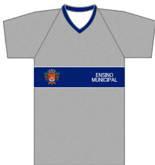
CAMISETA MANGA RAGLAN